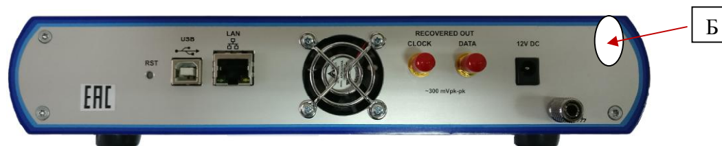
Рисунок 2 – Вид задней панели осциллографов и схема пломбировки от несанкционированного доступа (Б)